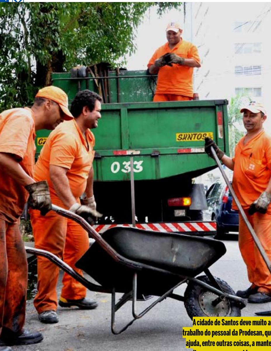
A cidade de Santos deve muito ao trabalho do pessoal da Prodesan, que ajuda, entre outras coisas, a manter limpas as ruas, avenidas, praças, calçadas e outros logradouros

Sindicato dos Trabalhadores nas Indústrias da Construção Civil, Montagem e Manutenção Industrial e do Mobiliário de Santos