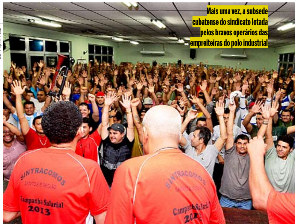
Mais uma vez, a subsele cubatense do sindicato lotada pelos bravos operários das empreiteiras do polo industrial