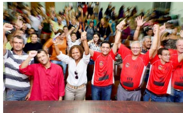
Assembleia do pessoal da Cursan, ontem à noite, lotou subsele do sindicato