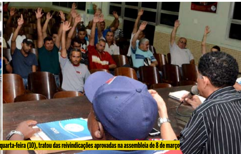
Primeira negociação com as empreiteiras de montagem e manutenção industrial, na quarta-feira (10), tratou das reivindicações aprovadas na assembleia de 8 de março