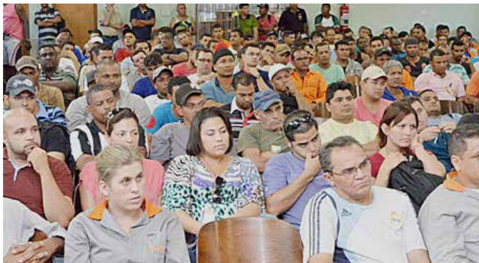
Homens e mulheres, de todas as idades, sabem que o sindicato é um instrumento de lutas

O não cumprimento de qualquer cláusula deste acordo acarreta multa de 10% do piso salarial do trabalhador qualificado, por infração e por empregado, revertendo seu valor à parte prejudicada.