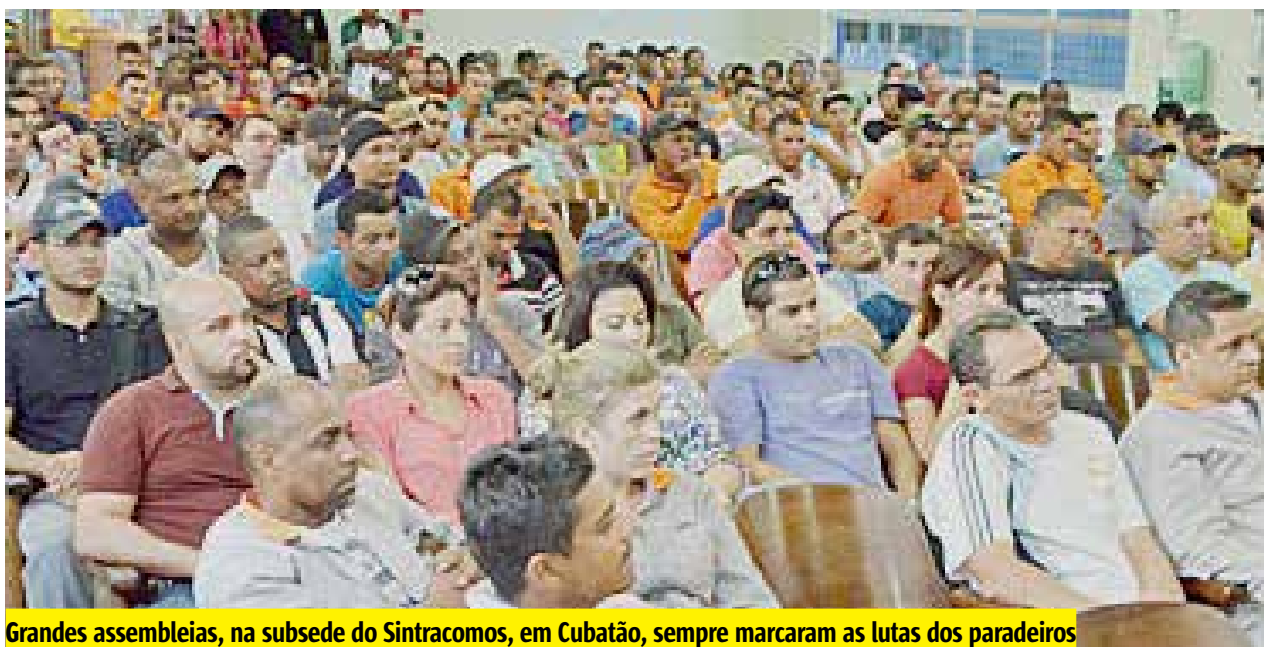
Grandes assembleias, na subsele do Sintracomos, em Cubatão, sempre marcaram as lutas dos paradeiros