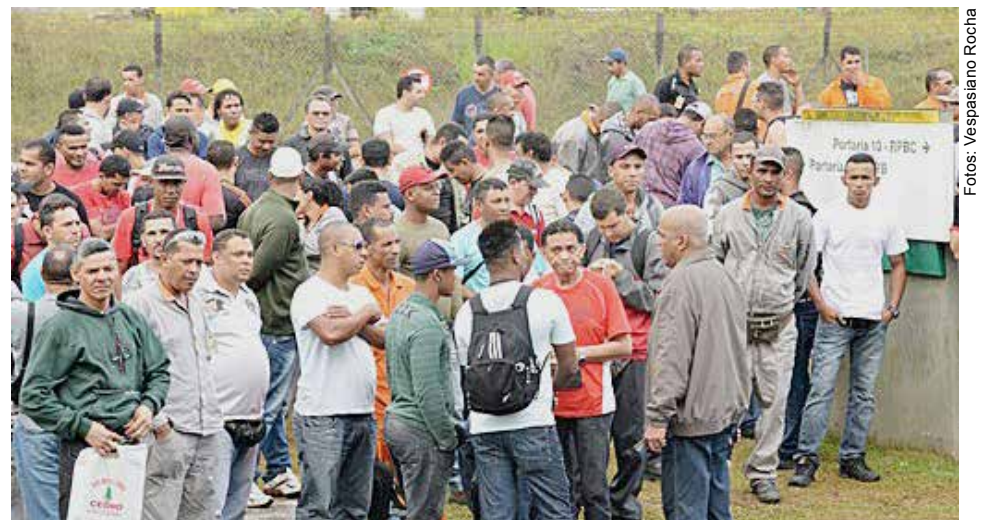
Muitos dos nossos direitos adquiridos foram conquistados na luta e na garra sindical