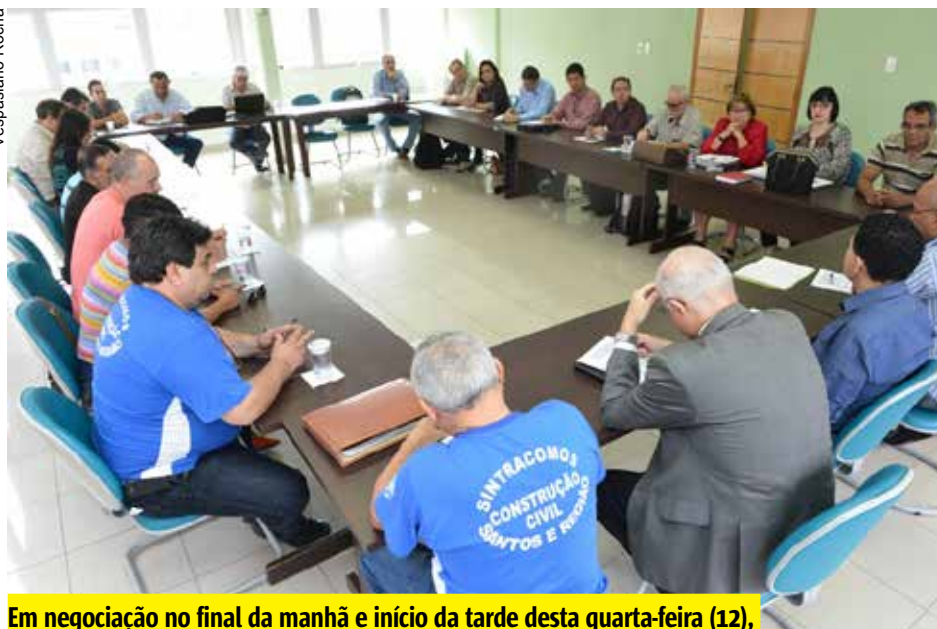
Em negociação no final da manhã e início da tarde desta quarta-feira (12), representantes do Sintracomos e das empreiteiras não chegaram a consenso