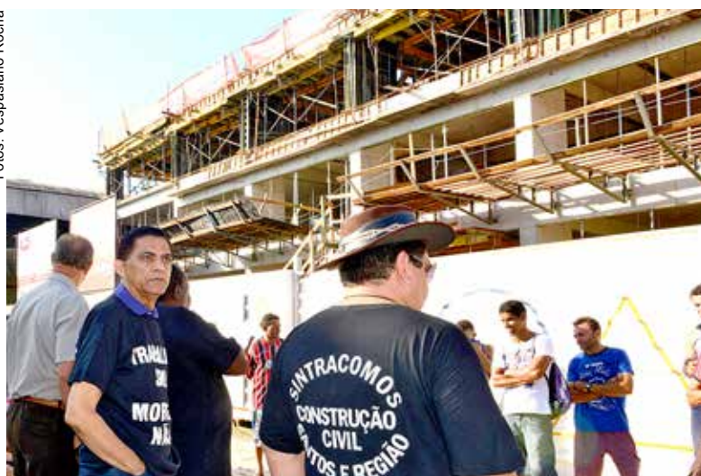
Chegou a hora do trabalhador cobrar a renovação vantajosa do acordo coletivo de trabalho